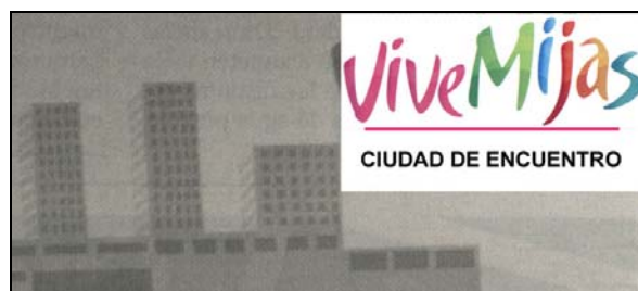
El municipio de Mijas somos un pueblo, no una ciudad

a los agotamientos irreversibles del territorio que suponen, por ejemplo, la expansión urbanística al uso, un parque empresarial en La Atalaya o un puerto deportivo en la costa mijeña, entre otros: pan pa hoy y hambre para mañana .