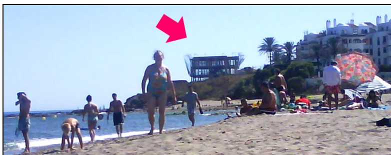
Nuestro particular “Hotel Algarrobico” mijeño, ¡¡de vergüenza!!

Otras cuestiones relacionadas con el MEDIO AMBIENTE que últimamente nos preocupan son, entre otras, el visto bueno que las administraciones parecen estar dándole a la construcción de lo que hemos venido a llamar El Algarrobico Mijeño : construcción de un gran chalet sobre los acantilados de la Playa del Bombo, a escasos metros de la mar en uno de los últimos rincones sin construir ilegalmente del litoral miheño . Tras una pregunta nuestra en el pleno, al parecer el Ayto. dice que tiene todos los permisos (por antiguos, no por adecuados a la filosofía de la legalidad actual), pero no entendemos por qué no se les ha retirado el permiso –y devuelto el dinero de la licencia si hiciera falta– como principio de precaución , en lugar de consentir esta nueva fechoría urbanística.